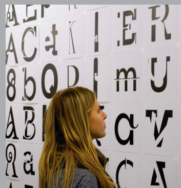
Foto: Die Vorlesung zum Thema Europäisches Design wird von der Fakultät Gestaltung der FHWS organisiert.

Donnerstag, 29. Januar 2015, 19:30 Uhr Hochschule für Musik, Hofstallstraße